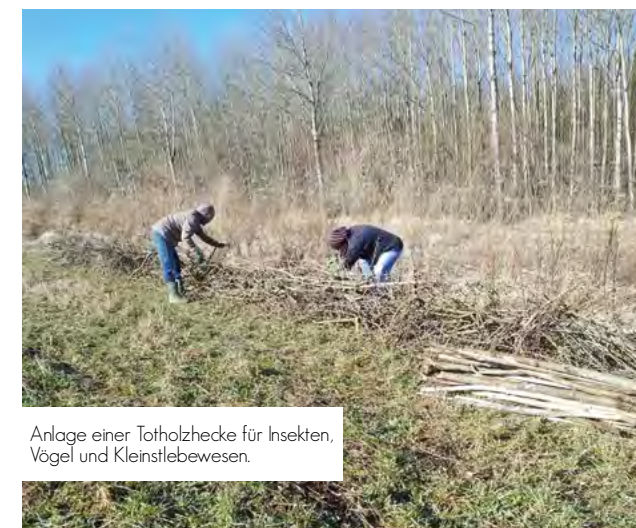
Anlage einer Totholzhecke für Insekten, Vögel und Kleinstlebewesen.