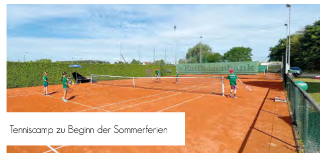
Tenniscamp zu Beginn der Sommerferien

Sportlich sind bei uns schon die Kleinsten ab einem Jahr in den unterschiedlichsten Baby- und Kinderturn-Gruppen bis zum Schuleintritt aktiv. Danach trainieren wir in festen Gruppen an Sportgeräten für Kids bis zur 5. Klasse und bieten Leichtathletik für Kinder ab 8 Jahren und Jugendliche. Tennis spielerisch lernen kann man bei uns begleitet von professionellen Trainern ab 4 Jahren. In den Kinder- und Jugendmannschaften wird dann regelmäßig trainiert und gespielt – im Sommer auf den vier schönen Sandplätzen auf dem Vereinsgelände, im Winter in den von uns dafür angemieteten Tennishallen oder der Schulturnhalle.