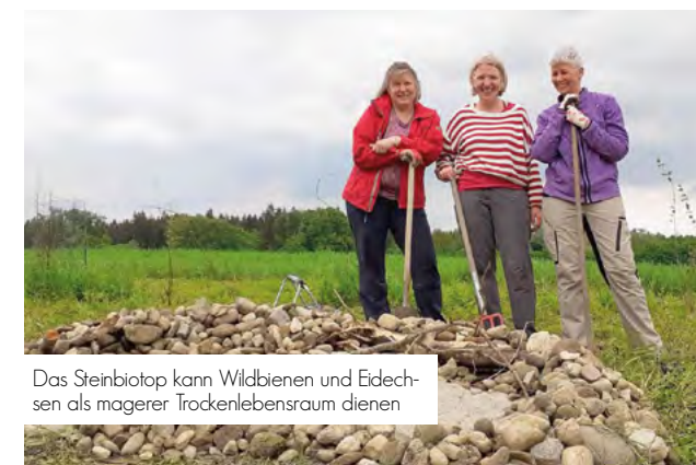
Das Steinbiotop kann Wildbienen und Eidechsen als magerer Trockenlebensraum dienen